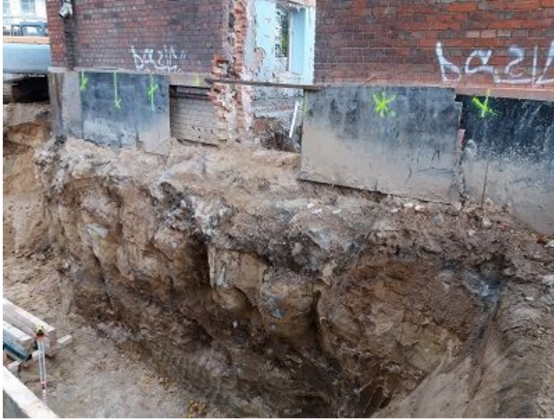
Podbicie istniejących łąw fundamentowych oraz ścian istniejącego budynku.