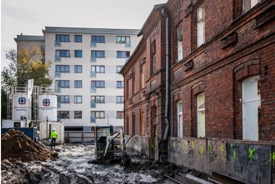
Podbicie istniejących ław fundamentowych oraz ścian istniejącego budynku.

Zleceniodawca: ZZOZ Poradnia Stomatologiczna DORMED D.C. Uszyńscy Sp.J.