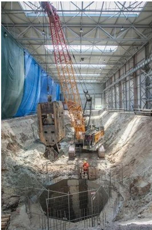
Wykonywanie ścian szczelinowych w szybie technologicznym.