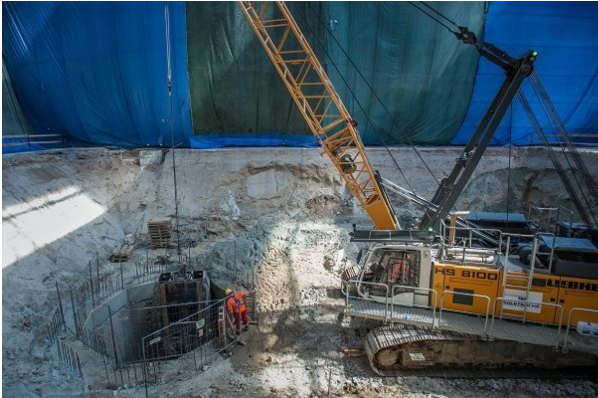
Wykonywanie ścian szczelinowych w szybie technologicznym.