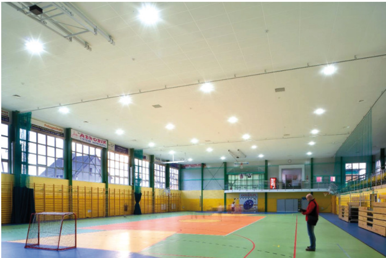
Sala sportowa przy SP nr 3 w Gogolinie. Dźwiękochłonny sufit podwieszany na całej powierzchni sali. Dźwiękochłonne panele ściennie instalowane na ścianie szczytowej na poziomie I piętra (szare pola).

Co w takim razie należy zrobić, aby zapewnić w sali sportowej poprawną akustykę i spełnić wymagania normy? Przede wszystkim należy zadbać o odpowiednią chłonność akustyczną pomieszczenia. Jak już wspomniałem wcześniej, typowe wykończenie sal sportowych (tynk, szkło, blacha trapezowa, podłoga sportowa itd.) jest bardzo „twarde” akustycznie i nie zapewnia wystarczającej chłonności. Zwykle należy ją zwiększyć 4-5 krotnie, wprowadzając do sali odpowiednią ilość materiałów dźwiękochłonnych. Do tego bardzo istotne jest rozmieszczenie tych materiałów. Najlepiej byłoby rozmieścić je równomiernie na wszystkich powierzchniach ograniczających pomieszczenie: ścianach, suficie a nawet podłodze. Byłby to najbardziej efektywny sposób wykorzystania materiałów dźwiękochłonnych, niestety całkowicie nierealny. W praktyce większość materiałów instalowanych jest na suficie pomieszczenia, a tylko 20-30% na ścianach. Istotny jest dobór systemów pod kątem ich właściwości dźwiękochłonnych. Warto wybierać rozwiązania charakteryzujące się wysoką dźwiękochłonnością. Ułatwi to nieco projektowanie, bo materiału będzie potrzeba nieco mniej niż w przypadku mniej efektywnych rozwiązań i łatwiej będzie znaleźć na niego miejsce. Wszystkie poniższe zalecenia dotyczą właśnie materiałów silnie dźwiękochłonnych (ważony wskaźnik pochłaniania dźwięku \alpha_w \geq 0,9 ).