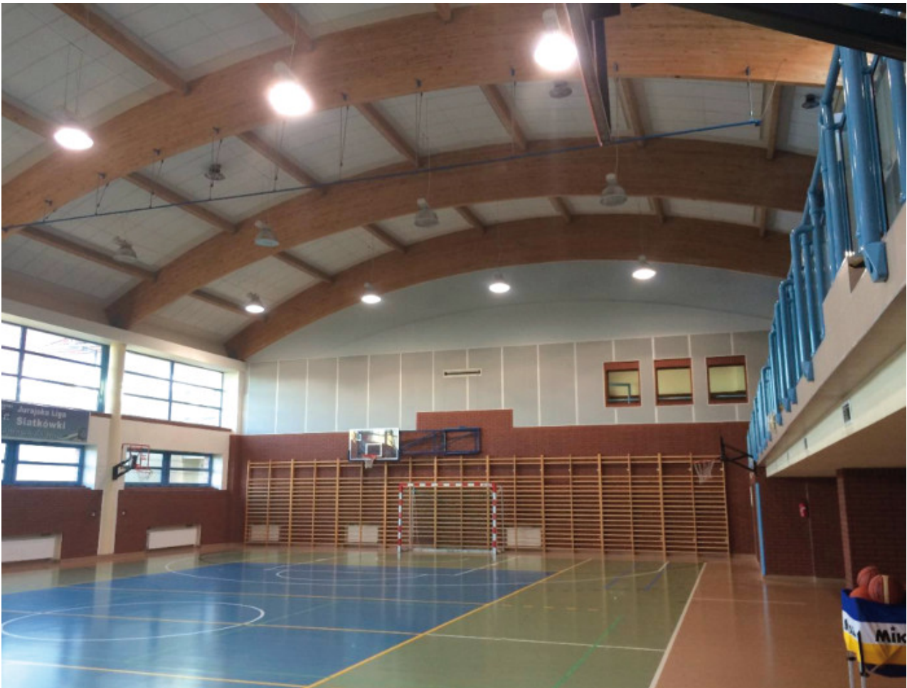
Sala sportowa w Pilicy poddana adaptacji akustycznej. Panele dźwiękochłonne instalowane jako ekrany w polach pomiędzy elementami konstrukcji dachu (pokrywając ok. 67% powierzchni dachu). Dźwiękochłonne panele ściennie instalowane na ścianach szczytowych nad okładziną klinkierową i drabinkami.

Czas pogłosu jest parametrem najczęściej stosowanym do opisu akustyki wnętrza. Mimo że niedoskonały, mówi nam dużo o charakterze akustycznym pomieszczenia. Jeśli wnętrze charakteryzuje się relatywnie krótkim czasem pogłosu, to znaczy, że jest cichsze, panują w nim lepsze warunki do komunikacji słownej (naturalnej czy z użyciem nagłośnienia), a w odbiorze subiektywnym wydaje się bardziej przytulne.