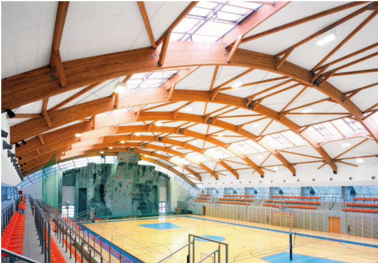
Hala sportowa Koło w Warszawie. Panele dźwiękochłonne instalowane w polach pomiędzy elementami konstrukcji dachu. Dźwiękochłonne panele ściennie instalowane za drabinkami gimnastycznymi oraz na ścianie szczytowej po obu stronach ścianki wspinaczkowej.