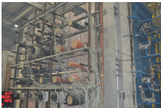
Fot. 1. Widok nienagrzewanej powierzchni elementu próbnego w trakcie badania w zakresie odporności ogniowej (uszczelnienia przejść rur do instalacji ogólnobudowlanych w ścianie)