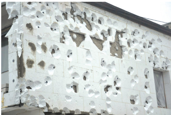
Fot. 1. Uszkodzenie izolacji termicznej wskutek aktu wandalizmu