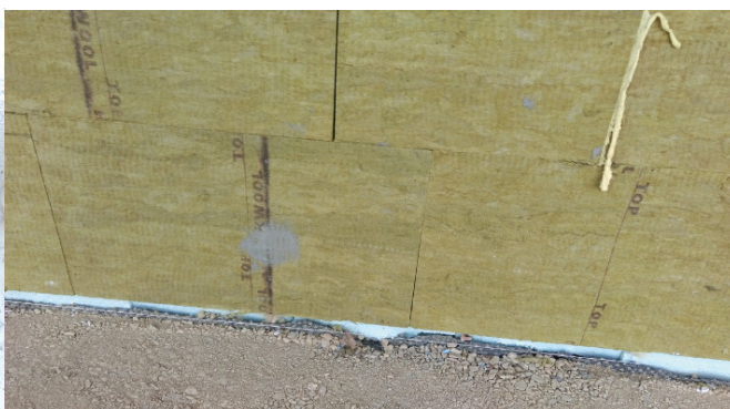
Fot. 4. Nieprawidłowe wypełnienie szczelin między wełną mineralną za pomocą pianki poliuretanowej