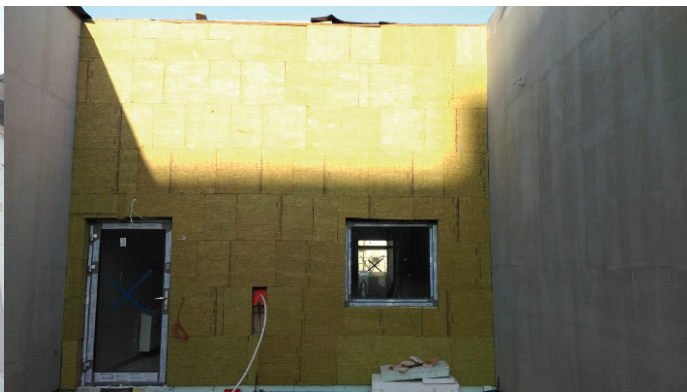
Fot. 2. Brak zabezpieczenia warstwy termoizolacyjnej przed oddziaływaniem warunków atmosferycznych