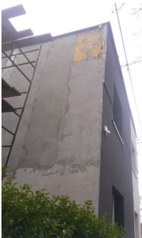
Fot. 5. Brak zastosowania siatki w warstwie zbrojonej

Podobny efekt uzyskamy przy braku zastosowania warstwy szczepnej pod wyprawę tynkarską. Innym błędem, popełnianym w trakcie robot tynkarskich, jest niedostosowanie grubości wyprawy do wytycznych producenta systemu. Zbyt duża grubość może doprowadzić do zarysowań tynku, z kolei tynk o zbyt małej grubości ok. 1-2 mm może nie pokryć w wystarczającym stopniu powierzchnię ściany. Jedną z przyczyn powstawania uszkodzeń w warstwie tynku zewnętrznego są nieprawidłowości wynikające z ewidentnego niedbalstwa prowadzenia robot budowlanych - np. brak zapewnienia szczelnych połączeń zróżnicowanych, sąsiadujących ze sobą tynków (np. o zróżnicowanych barwach) będzie powodowało postępującą destrukcję systemu ociepleń. Podobnie nieprawidłowe wykończenia tynków przy balustradach czy parapetach.