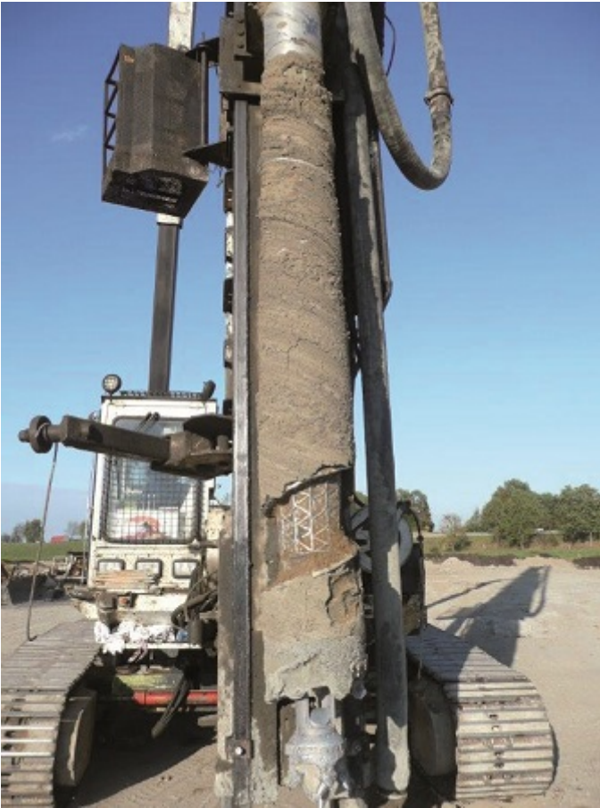
Fot. 3. Formowanie kolumn przemieszczeniowych

Zaletą kolumn przemieszczeniowych, w stosunku do kolumn formowanych metodą wibrowymiany lub mieszania wgłębne, jest możliwość formowania ich również w warstwach bardzo słabych gruntów. Dzięki ciągłemu procesowi tłoczenia mieszanki betonowej, która rozpycha słaby grunt i tworzy w nim pogrubienia trzonu, nie ma obawy „rozpłynięcia się” lub osłabionych przewarstwień kolumn.