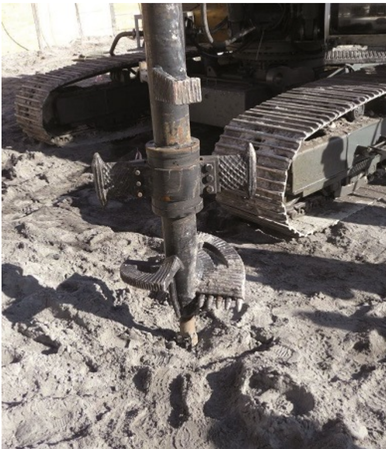
Fot. 2. Przykład świdra do wykonywania

Wymagania dotyczące wykonywania i projektowania zawiera norma PN-EN 14679.