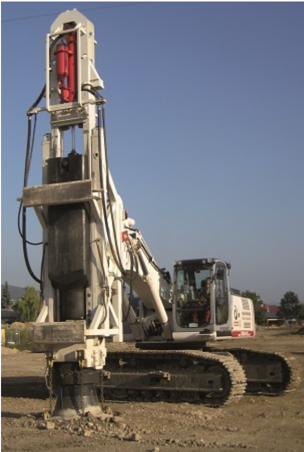
Fot. 5. Urządzenie do szybkiego ubijania impulsowego

Metoda szybkiego ubijania impulsowego jest skuteczna przy zagęszczaniu nienawodnionych rodzimych i nasypowych gruntów niespoistych, gruntów zapadowych, odpadów przemysłowych, gruzu, śmieci, zwykle do głębokości 5 m, w sprzyjających warunkach nawet do 8 m. Stosowana jest w celu poprawy parametrów geotechnicznych (sztywności i nośności) i redukcji osiadań.