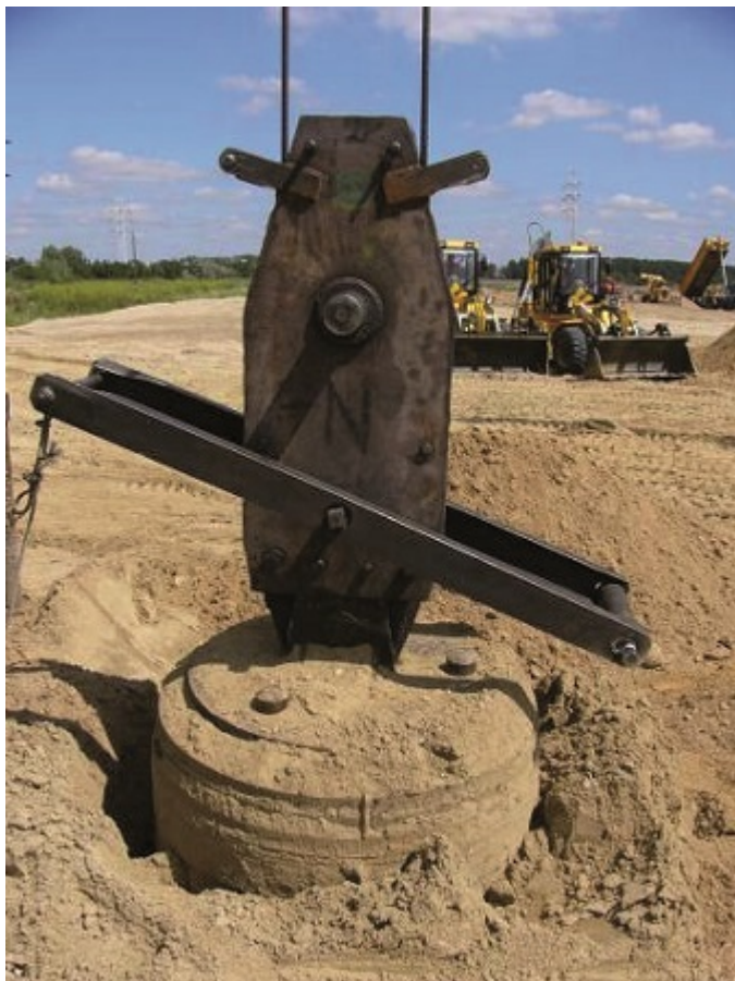
Fot. 4. Formowanie kolumny wybijanej

Warstwa powierzchniowa terenu lub platformy pozostaje luźna i wymaga dodatkowych zabiegów, np. zagęszczenia walcami. Bardzo dobre wyniki i szybki trwały efekt daje dogęszczenie powierzchni za pomocą ubijania (ciężkiego lub impulsowego).