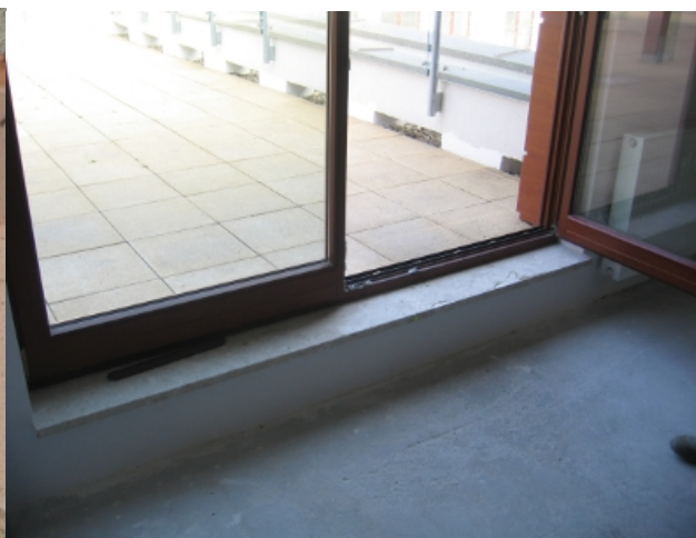
Fot. 2. Poziom nawierzchni tarasu przewyższający poziom posadzki w mieszkaniu uniemożliwia prawidłowe zakończenie warstwy hydroizolacyjnej przy drzwiach