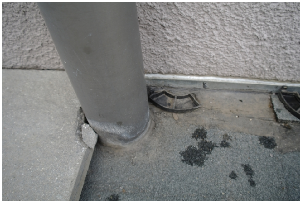
Fot. 3. Brak uszczelnienia przebicia izolacji balkonu przez rurę spustową