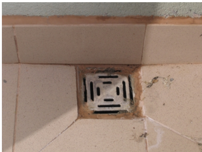
Fot. 1. Nieprawidłowy sposób osadzenia wpustu tarasowego bezpośrednio przy ścianie budynku

Pomimo, że wymagania dotyczące sposobu wykonania warstw nawierzchniowych na tarasach i balkonach wydają się proste, nie zawsze są oczywiste dla projektantów i wykonawców robót. Popełniane błędy są przyczyną pojawiania się wody i wilgoci w pomieszczeniach przyległych do tarasu (balkonu) lub w pomieszczeniach znajdujących się poniżej.