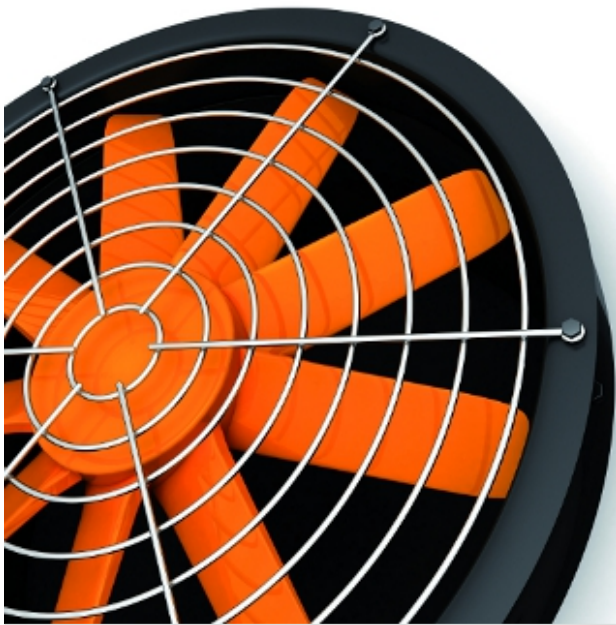
Fot. 2.

Wentylatory wyposażone w silniki elektronicznie komutowane (silniki EC) charakteryzuje niski pobór energii elektrycznej. Układ komutacji utrzymuje obroty wirnika wentylatora w optymalnym obszarze pracy. Mogą pracować przy różnych prędkościach, dopasowując się do wymaganej ilości powietrza przy zachowaniu najwyższej sprawności. Przetłaczając taką samą ilość powietrza jak wentylatory konwencjonalne pobierają wyraźnie mniej energii (oszczędności kosztów eksploatacji do 40%). Jednocześnie są to wentylatory cichsze oraz o dłuższej żywotności niż wentylatory tradycyjne.