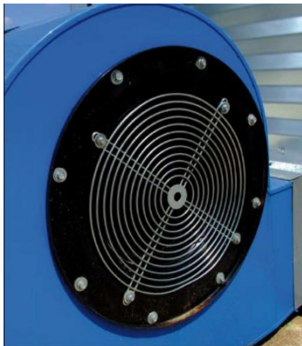
Fot. 3.