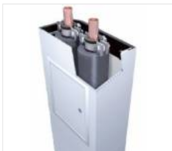
Listwy maskujące (10)