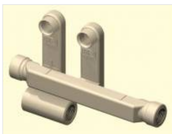
Przyłącza grzejnikowe (12)