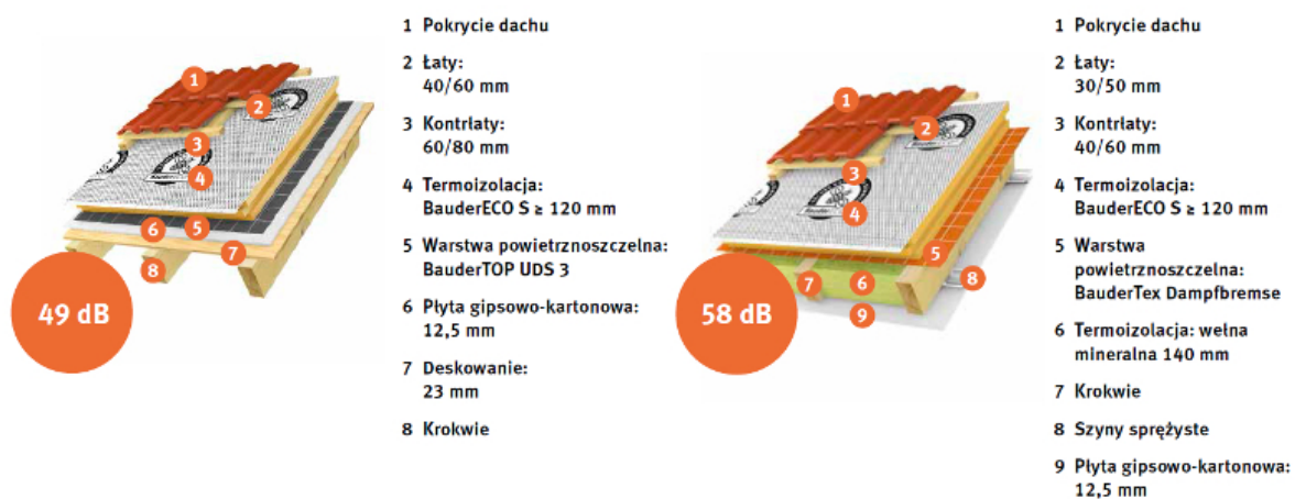
Rys.1. BauderECO S zapewnia najlepsze wartości izolacyjności akustycznej

Ekonomiczne i przyjazne w użytkowaniu. Zapewniają sklejenie termoizolacji, dzięki czemu natychmiast po montażu izolowana powierzchnia staje się odporna na przepływ wsteczny oraz staje się wiatroszczelna. Sklejenie zakładów następuje zgodnie z zasadą klej w kleju, co zapewnia najwyższe bezpieczeństwo.