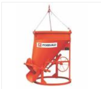
Zbrojenie odginane (22)