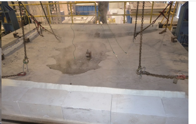
Fot. 2d. Strona nienagrzewana żelbetowej płyty o grubości 15 cm. Oddziaływanie standardowe od dołu. T = 120 min