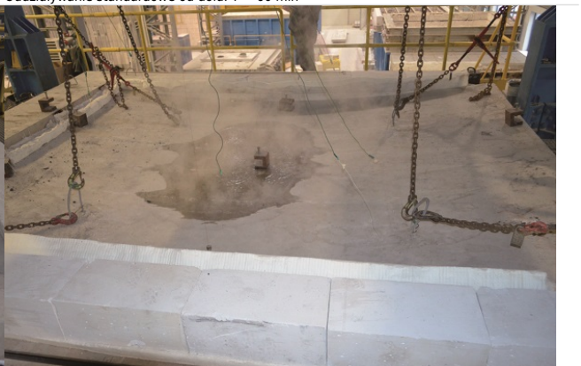
Fot. 2d. Strona nienagrzewana żelbetowej płyty o grubości 15 cm. Oddziaływanie standardowe od dołu. T = 120 min