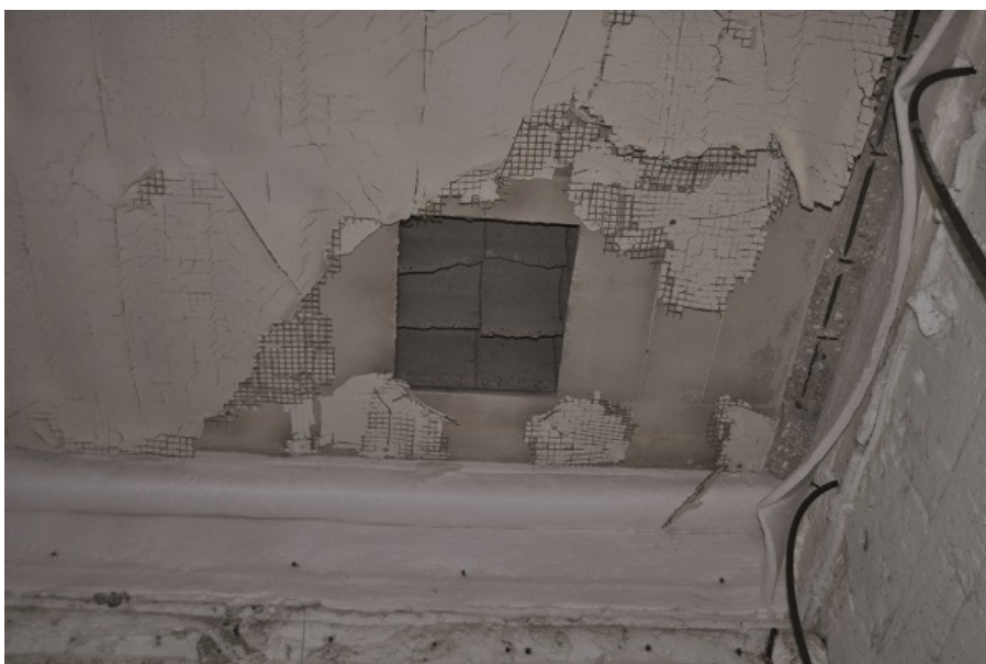
Fot. 1c. Strop jak na fot. 1a po 120 min oddziaływania standardowego. Widok od strony nagrzewanej (od strony pieca). Widoczne odpadnięcie dolnych ścianek pustaków