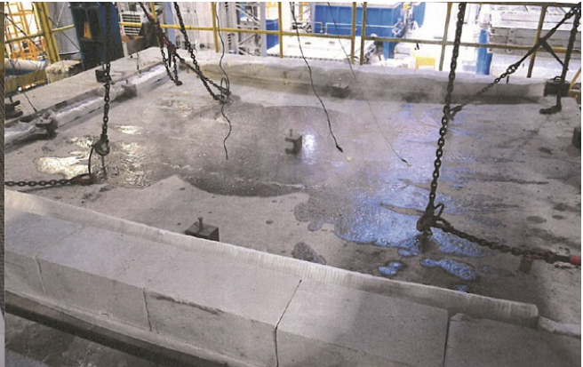
Fot. 2c. Strona nienagrzewana żelbetowej płyty o grubości 15 cm. Oddziaływanie standardowe od dołu. T = 60 min