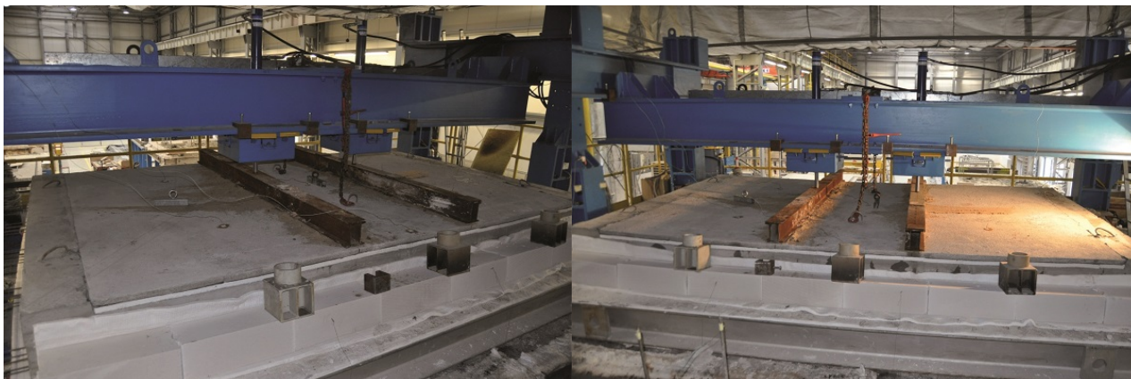
Fot. 1a. Strop gęstożebrowy na belkach sprężonych, rozpiętość w świetle podpór 424 cm, grubość 36,5 cm, pustaki betonowe o wysokości 20 cm i szerokości 53 cm. Strona Fot. 1b. Strop jak na fot. 1a po 120 min oddziaływania standardowego nienagrzewana, widok przed badaniem