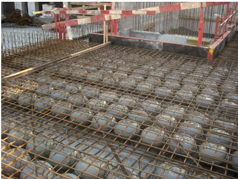
Fot. 3. Strop żelbetowy z wypełnieniami typu cobiax

dr inż. Paweł Sulik Zakład Badań Ogniwych Instytut Techniki Budowlanej